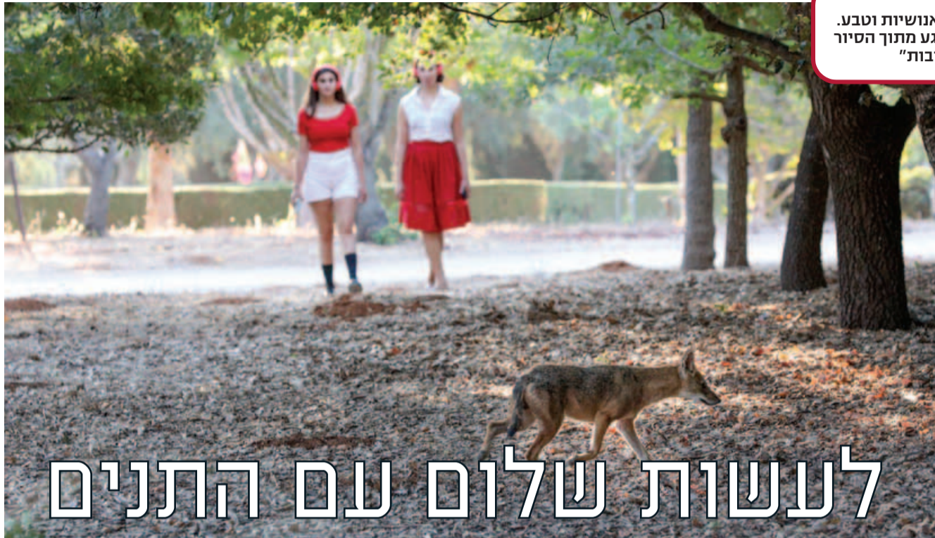
חיבור של אנושיות וטבע. גל נסים ורגע מתוך הסיור "יללות זהובות"